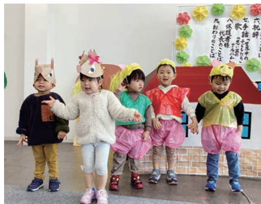
■本社に併設のにじいる保育園卒園式の様子

また、3月30日には、「第42期事業計画発表会」を行いました。業績発表や部門別の予算と事業計画の発表を行い、共通の認識を図れたのではないのでしょうか。参加できなかった社員にも、目指すべきところが何なのか、自身がどのような動きをしなくてはならないのか、各責任者から発信し、当社一丸となり、目標達成をしたいものです。記事：KT