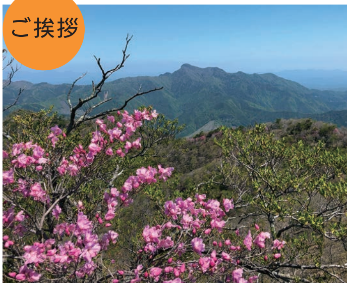
■アケボノツツジと傾山(大分・宮崎県境)

春暖の候、貴社ますますご清栄のこととお慶び申し上げます。平素は格別のご高配を賜り、心から感謝いたしております。