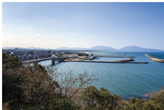
遠賀川河口の魚見公園から芦屋漁港と三里松原海岸を望む

遠賀川は、1 級河川のため多種多様な生き物も生息しておりその生態系も遠賀川のサイトにいろいろと掲載されています。ぜひご覧ください。記事:T.S