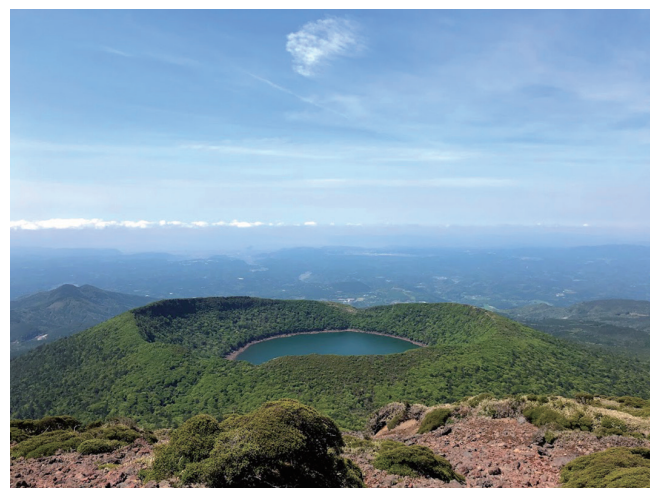
大浪池（標高 1241m にある霧島山の火口湖。鹿児島県霧島市）